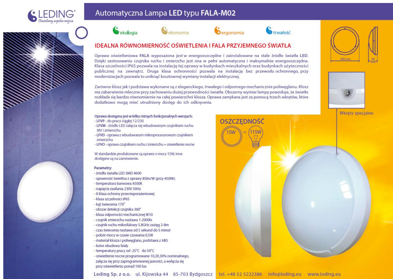
Rysunek 3 Lampa zewnętrzna, cena: 150 zł netto szt